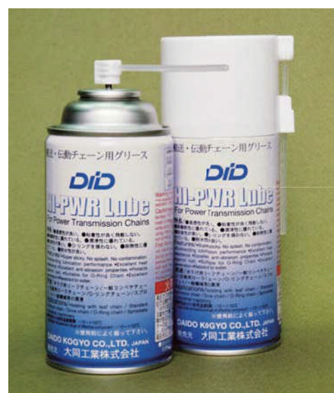
LPG、DME使用 内容量 330ml

チェーンのピン・ブシュおよびブシュ・ ローラ間に素早く浸透・粘着し、優れた 潤滑を発揮します。